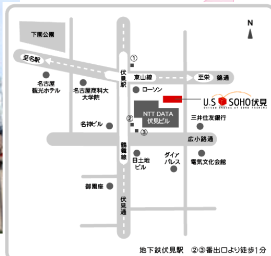
地下鉄伏見駅 ②③番出口より徒歩1分